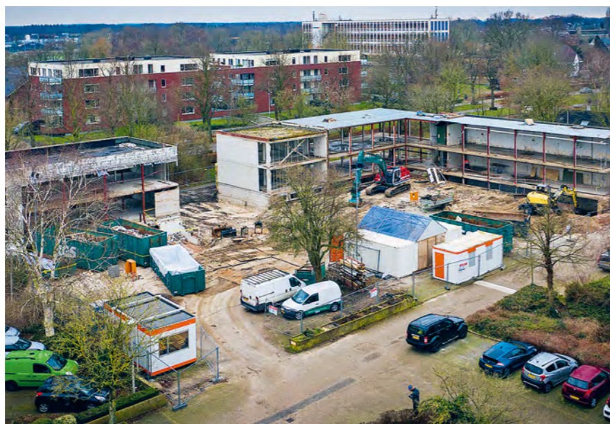
Voor de bouw van Villa Verde in Harderwijk wordt 90% van de materialen in het bestaande gebouw opnieuw gebruikt