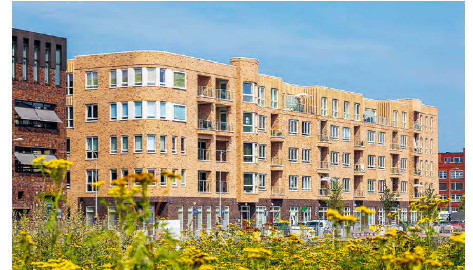
Met LIFE in Amsterdam is een plek gecreëerd waar lhbtqi+-vriendelijk samenleven centraal staat

BpfBOUW wil een bijdrage leveren aan het terugdringen van CO 2 -uitstoot. Daarom investeren we onder andere in de isolatie van gebouwen, in 'slimme' verwarmings-, koelings- en verlichtingssystemen en in het opwekken van duurzame energie. We hebben bijvoorbeeld geïnvesteerd in het duurzaam maken van het World Trade Centrum Rotterdam. Dit hoge kantoorgebouw is van energielabel E naar energielabel A gegaan. Label A is het meest energiezuinig. Dit is bereikt door een geheel nieuw systeem voor