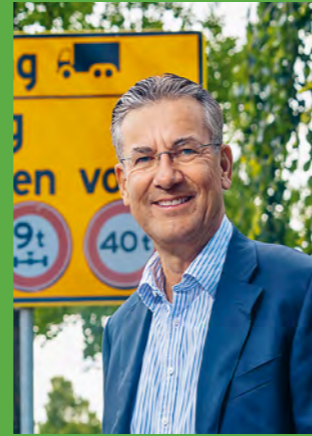
Maxime Verhagen (Maastricht, 1956) zat ruim 25 jaar namens het CDA in de politiek. Hij was onder meer lid van de gemeenteraad in Oegstgeest, lid van het Europees Parlement, fractievoorzitter in de Tweede Kamer, minister van Buitenlandse Zaken en vice-premier. In 2013 werd hij voorzitter van Bouwend Nederland.

De bouw en de infra is een prachtige, dynamische sector die werkt aan