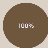
2. Afstemming beleggingen op taxonomie exclusief staatsobligaties*

* In deze diagrammen omvat "staatsobligaties" alle blootstelling aan overheden.